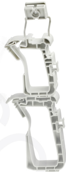
przykład łączenia uchwytów