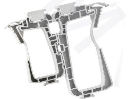
przykład łączenia uchwytów

materiał: polipropylen, temperatura pracy: -40°C do +80°C minimalna temperatura montażu: -10°C, odporność na działanie płomieni zgodna z VDE 0471/DIN IEC 695 kolek montażowy \varnothing 6